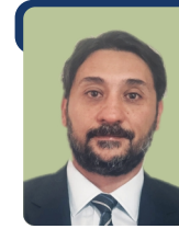
ÖZGÜR ÖZSOY ÇOLAKOĞLU METALURJİ