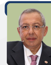
AHMET İLHAN TURAN TOSYALI YASSI YAPISAL ÇELİK