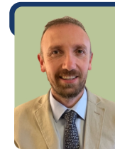
AYDIN ŞELTE UDDEHOLMS AB