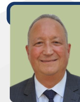
N. İZZET ULU TMMOB METALURJİ ve MALZEME MÜH. ODASI